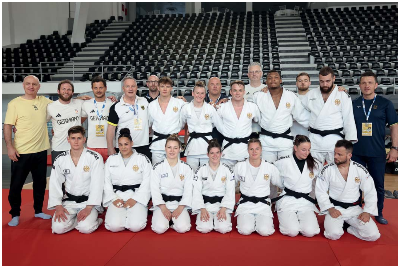
Das gesamte deutsche Team in Podgorica