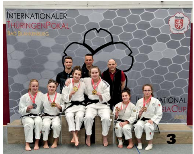
Die Medaillengewinnerinnen in Bad Blankenburg