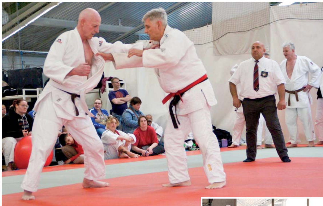
Auch die Männer über 60 Jahre nahmen am Senioren-Cup in Bochum zahlreich teil