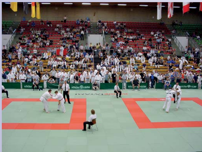
Deutsche Einzelmeisterschaften der Frauen U 17 und Männer U 17 in Duisburg