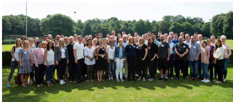
Alle Fachkräfte der Kreis- und Stadtsportbünde und der Fachverbände bei der Jahrestagung 2017 (c) LSB NRW | Foto: Andrea Bowinkelmann.

Eine Liste aller Fachkräfte finden Sie hier: Liste